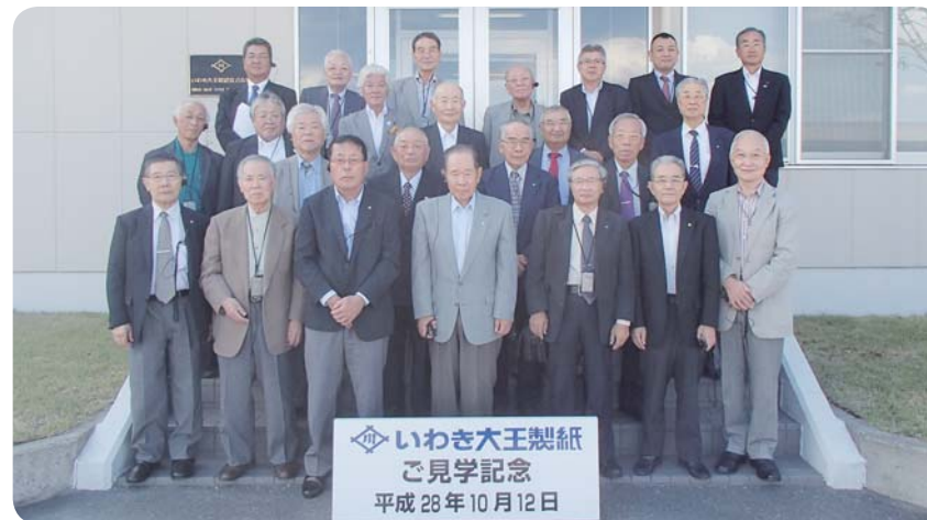
いわき大王製紙 ご見学記念 平成 28 年 10 月 12 日